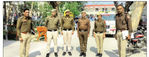
सीवन। परीक्षा भवन के सामने तैनात पुलिस बल।