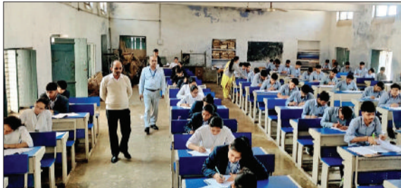
जींद। परीक्षा केंद्र पर परीक्षा देते बच्चे।

मुख्यमंत्री नाथ सिंह ने जिला के सभी उपयुक्तों को वीडियो कॉन्फ्रेंसिंग के माध्यम से आवश्यक दिशा-निर्देश दिए। डीसी ने कहा कि जिला में संचालित हो रही परीक्षा के दृष्टिकोण कानून व्यवस्था बनाए रखने के लिए पुख्ता प्रबंध किए गए हैं। डीसी ने निर्देश दिए कि सभी एसडीएम अपने-अपने उपमंडल में संबंधित डीएसपी के साथ समन्वय स्थापित करें तथा स्वयं भी फॉरवर्ड में उपस्थित रहें। प्रत्येक अधिकारी कम से कम एक परीक्षा केंद्र का निरीक्षण अवश्य करें। उन्होंने सभी एसडीएम को निर्देश देते हुए कहा कि ग्रामीण क्षेत्रों में बने केंद्रों में परीक्षाओं को नकल रहित करवाने के लिए संबंधित नंबरदार, सरपंच एवं पंचायत सदस्यों से प्रशासन का सहयोग करने के लिए संबंध स्थापित करें। जिला प्रशासन द्वारा कंट्रोल रूम स्थापित किया गया है। किसी भी प्रकार की कानून व्यवस्था संबंधी समस्या की सूचना तत्काल देने के निर्देश दिए गए हैं। आवश्यकता पड़ने पर अतिरिक्त पुलिस बल उपलब्ध करवाया जाएगा।