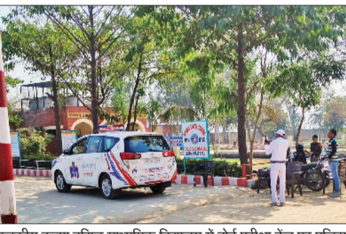
राजकीय कन्या वरिष्ठ माध्यमिक विद्यालय में बोर्ड परीक्षा केंद्र पर पुलिस की टीम