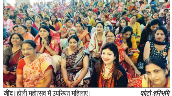
जींद। होली महोत्सव में उपस्थित महिलाएं।

उचाना। उचाना भाजपा मंडल महामंत्री रमेश राणा ने कहा कि 18 को उचाना में विधायक देवेन्द्र अत्री की अगुवाई में हुई विकास रैली में सीएम नायब सिंह सैनी ने उचाना हलके को सौगात देने का काम किया। 103 करोड़ से अधिक विकास के कामों का उद्घाटन एवं शिलान्यास किया तो 200 करोड़ से अधिक विकास के कार्यों की घोषणा की। ये रैली विकसित उचाना के सपने को पूरा करने में कारगर साबित होगी। रैली में उमड़ी रिचर्ड तोड़ मीड ने एक बात साबित कर दी कि विद्यार्थक अत्री की लोकप्रियता उचाना में हर रोज बढ़ रही है। रैली को रेलवा बका इतिहास एवं शिलान्यास किया तो उचाना का काम किया। रैली में उमड़ी मीड सीएम नायब सिंह सैनी, विधायक देवेन्द्र चतरभुज अत्री की लोकप्रियता का प्रमाण है।