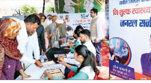
नवीन जिन्दल फाउंडेशन के सौजन्य से कैम्प में भाग लेते ग्रामीण।