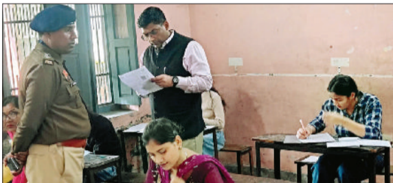
जींद। परीक्षा केंद्र का निरीक्षण करते डीसी व एसपी।